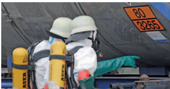
Aufgaben, die nur die Feuerwehr bewältigen kann: die Feuerwehr im Gefahrguteinsatz

Die tägliche Abwehr von Gefahren für Leib und Leben, Sachwerte und Umwelt verteilt sich auf drei unterschiedlich organisierte und strukturierte Institutionen: die Polizei, den Rettungsdienst und die Feuerwehren. Diese kann man auch als die drei Säulen der täglichen Gefahrenabwehr bezeichnen.