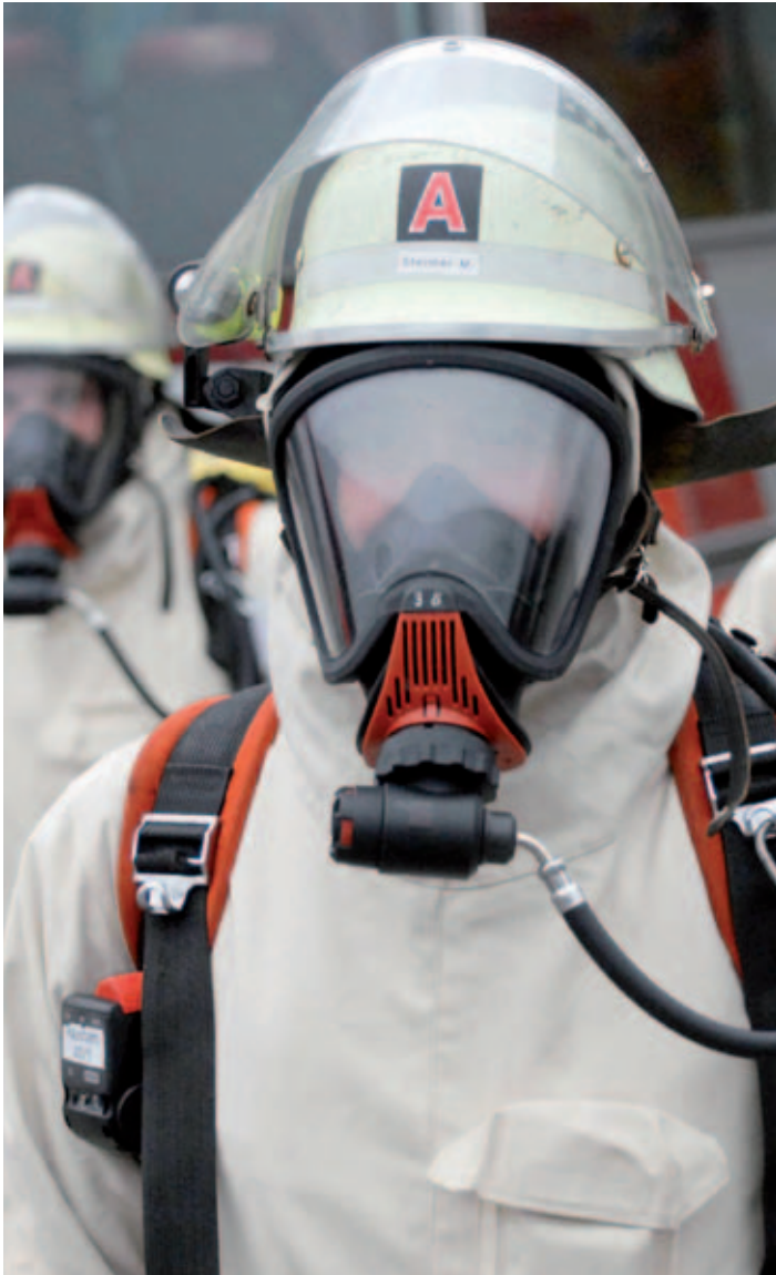
Aufgaben, die nur die Feuerwehr bewältigen kann: Einsatz mit Strahlenschutzrüstung in kontaminierten Bereichen

Die Ausstattung mit automatischen Defibrillatoren hat beim Herz- und Kreislaufstillstand neue Rettungschancen eröffnet, die jedoch nur bei einem Eingreifen innerhalb von 3 bis 5 Minuten Wirkung zeigen. Viele Feuerwehren nutzen diese Chancen bereits. Im Jahre 2011 wurden bei First-Responder-Einsätzen durch die Feuerwehren 9.508 Personen gerettet – ehrenamtlich und kostenfrei.