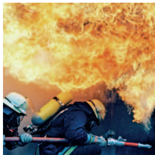
Aufgaben, die nur die Feuerwehr bewältigen kann: Spreizereinsatz zur Personenbefreiung (links) und Brandbekämpfung unter Atemschutz mit der Gefahr eines Flash-Over (rechts)

Weil die Feuerwehren ein sehr engmaschiges Netz von Gemeinden- und Ortsteilfeuerwehren haben und mit insgesamt 320.000 Feuerwehrleuten das größte Hilfeleistungspotenzial stellen, übernehmen sie auch originäre Polizeiaufgaben, z.B. bei der Verkehrslenkung oder bei der Suche nach vermissten Personen. Das engmaschige Netz mit sehr kurzen Eingreifzeiten ermöglicht es den Feuerwehren, das therapiefreie Intervall bis zum Eintreffen des Rettungsdienstes